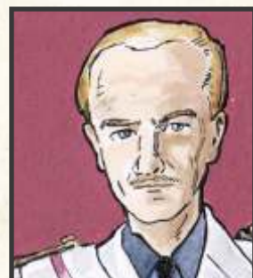
Ramón Serrano Suñer